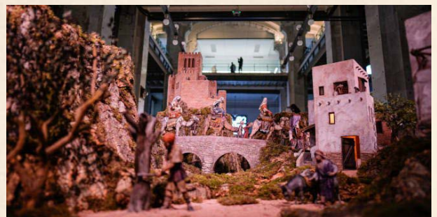
Belén del Ayuntamiento en Palacio de Cibeles.

📌 Precio: 2 €/persona | Todas las edades (Los menores inscritos estarán al cargo de su padre o madre, que serán quienes les inscriban y acompañen a la actividad. La organización no se hace responsable de los menores inscritos). Necesaria inscripción por teléfono o presencial hasta el 10 de diciembre.